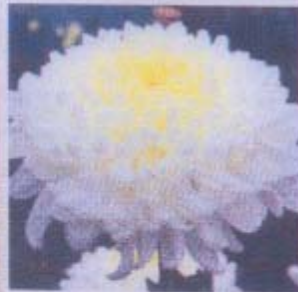
ดอกเบญจมาศ