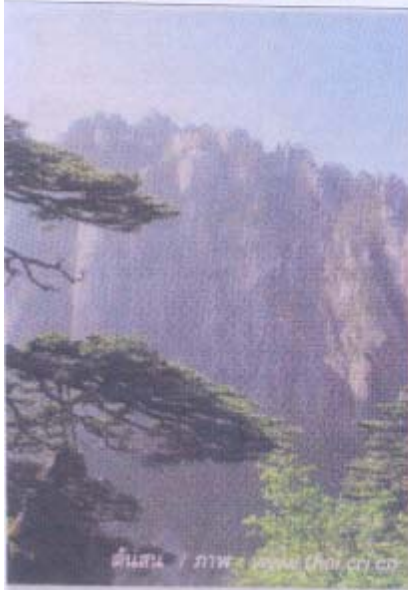
ต้นสน

ได้เขียนเกริ่นบทหนึ่ง โดยเปรียบเทียบดอกเบญจมาศว่าเป็นนักปราชญ์ ผู้มีจริยบรรดางาม ซึ่งบทกวีนี้ได้รับความนิยมยกย่องว่าเป็นบทกวีที่ไพเราะงดงามมาก