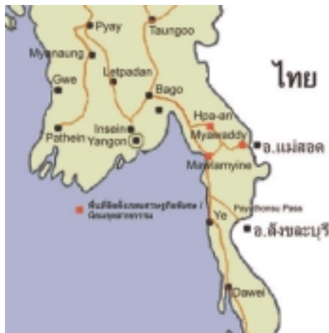
รูปที่ 1 พื้นที่เป้าหมายโครงการจัดตั้ง เขตเศรษฐกิจพิเศษ/นิคมอุตสาหกรรม

เชื่อมโยงเศรษฐกิจในแนวตะวันตก- ตะวันออกกับประเทศเพื่อนบ้านในภูมิภาคได้