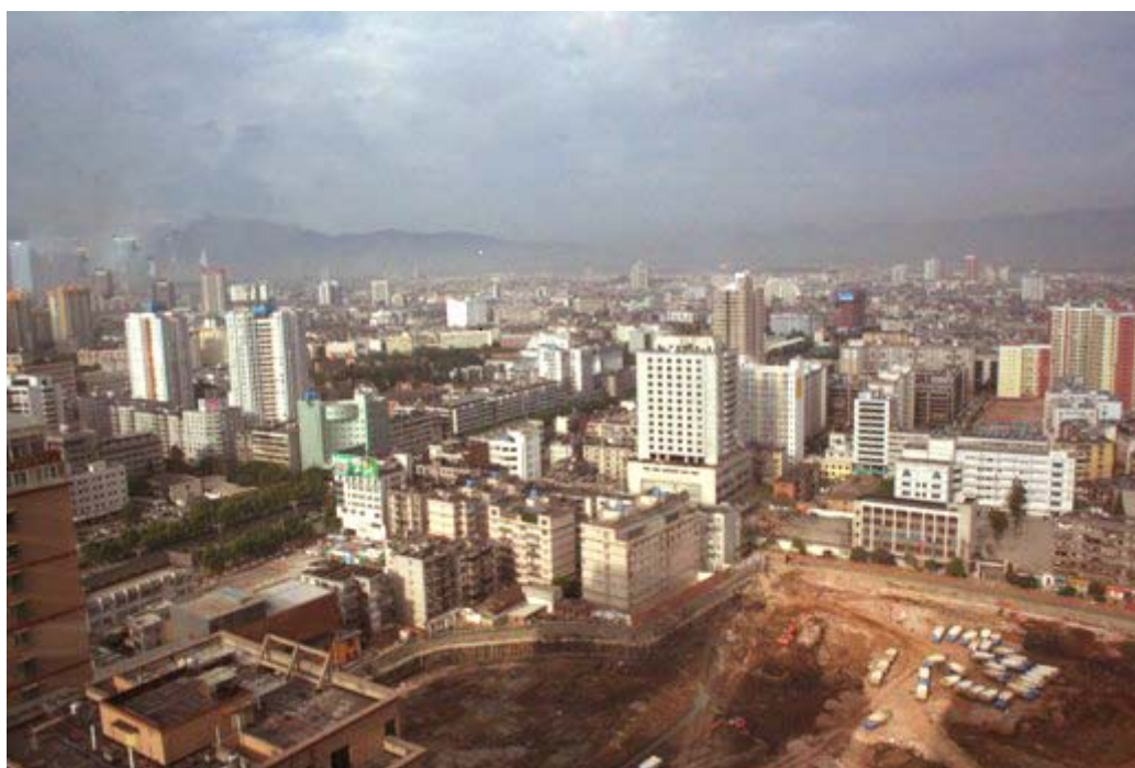
ภาพการลงทุนด้านอสังหาริมทรัพย์ในนครคุนหมิง มณฑลยูนนาน

อย่างไรก็ตาม เศรษฐกิจมณฑลยูนนานอาจจะเผชิญกับความเสียหายหลายประการ อาทิ ภาวะความแห้งแล้งที่อาจส่งผลกระทบต่อผลผลิตเกษตรและรายได้ของเกษตรกร ปัญหาการลงทุนที่มีแนวโน้มเติบโตในอัตราที่ชะลอลง ความไม่สมดุลของอุปสงค์และอุปทานในภาคพลังงาน ปัญหาประสิทธิภาพของการขนส่งทางรถไฟ ตลอดจนราคาสินค้าอุปโภคบริโภคที่ปรับตัวสูงขึ้น ซึ่งปัจจัยดังกล่าวหากไม่ได้รับการแก้ไขอาจส่งผลกระทบต่ออัตราการขยายตัวของเศรษฐกิจในระยะต่อไป