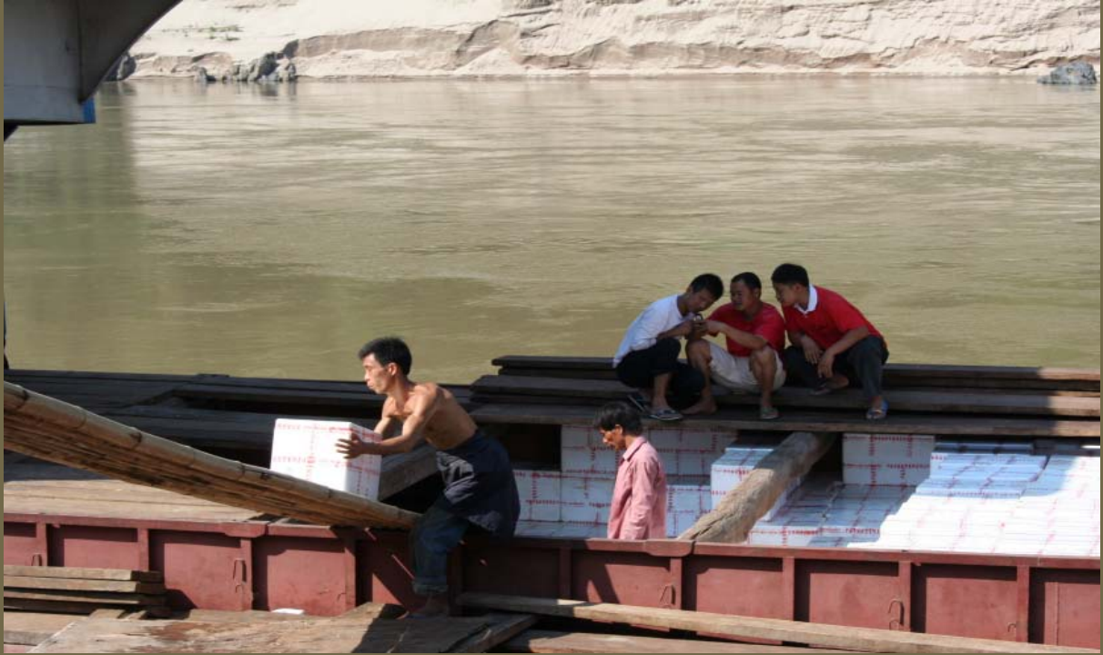
ภาพ : การขนส่งผักสดจากจีนมาไทยทางแม่น้ำโขง