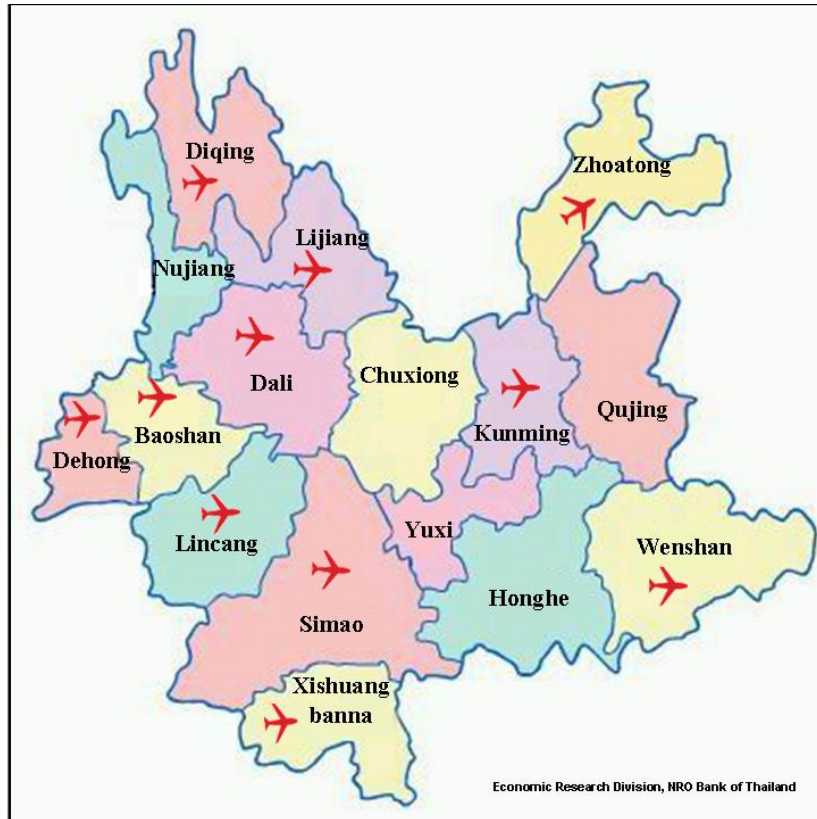
ที่ตั้งสนามบินภายในมณฑลยูนนาน

สนามบินซือเหมา (Simao) สนามบินต้าหลี่ (Dali) สนามบินลี่เจียง (Lijiang) สนามบินปาวซาน (Baoshan) สนามบินหลินชาง (Lincang) สนามบินเซียงเก้อลีลา (Xianggelila) หรือ สนามบินจงเตี้ยน (Zhongdian) สนามบินเต๋อหงหมางซือ (Dehongmangshi) และสนามบินเหวินชาน (Wenshan) ซึ่งเพิ่งเปิดดำเนินการอย่างเป็นทางการเมื่อเดือนกันยายน 2549 ที่ผ่านมา