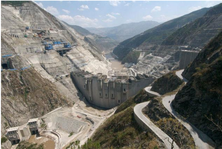
โครงการเขื่อนและโรงไฟฟ้าเสียววาน (แม่น้ำโขง)

มณฑลยูนนานมีสถานีผลิตกระแสไฟฟ้าพลังความร้อนขนาดใหญ่ 7 แห่ง และสถานีผลิตกระแสไฟฟ้าพลังน้ำขนาดใหญ่รวม 6 แห่ง (บางแห่งอยู่ระหว่างการก่อสร้าง) โดยมีสถานี ขนาดเล็กจำนวนมากมายกัวมณฑล ในปี 2548 ยูนนานผลิตกระแสไฟฟ้าได้รวม 62,420 ล้านกิโลวัตต์ต่อชั่วโมง กระแสไฟฟ้าที่ผลิตได้จะใช้ภายในมณฑลและส่งไปยังมณฑลภาคตะวันออก