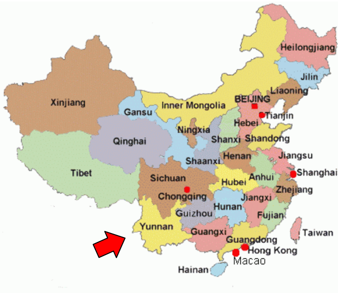
แผนที่จีนและมณฑลยูนนาน

มณฑลยูนนาน ตั้งอยู่ทางภาคตะวันตกเฉียงใต้ของจีน เป็นมณฑลที่ไม่มีทางออกทะเล มีอาณาเขตติดต่อกับ 2 มณฑล คือ ทิศเหนือติดกับมณฑลเสฉวน (Sichuan) ทิศตะวันออกติดกับมณฑลกุ้ยโจว (Guizhou) และติดต่อกับ 2 เขตปกครองตนเอง (เทียบเท่ามณฑล) คือทิศตะวันออกติดเขตปกครองตนเองกวางสีจ้วง (Guangxi) และทิศตะวันตกเฉียงเหนือติดกับเขตปกครองตนเองทิเบต (Xizang)