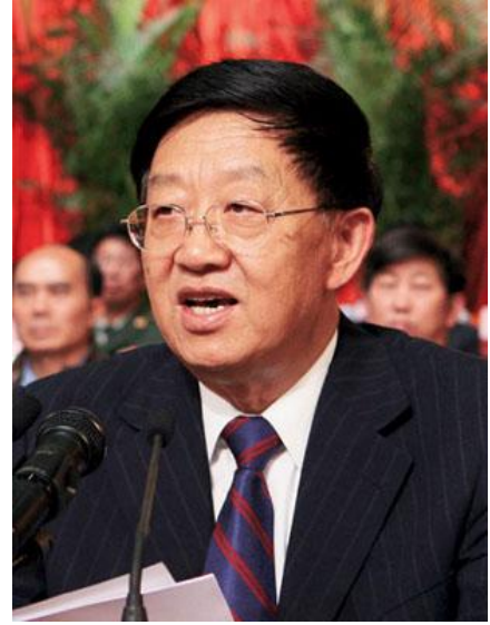
ประธานสภาประชาชนมณฑลยูนนาน นายไป่ เอ็นผุย (Bai Enpei) 白恩培

ประธานคณะกรรมการการทหารส่วนกลาง ให้ความเห็นชอบการเข้าดำรงตำแหน่งของ นายกรัฐมนตรี (ซึ่งเสนอชื่อโดยประธานาธิบดี) และ มন্ত্রীแห่งรัฐ (State Council) ตามรายชื่อที่เสนอโดย นายกรัฐมนตรีเลือกสรรประธานศาลประชาชนสูงสุด (the President of the Supreme Court) และประธาน อัยการประชาชนสูงสุด (the President of the Procurator-General of the Supreme People's Procuratorate) สมาชิกสภาประชาชนจีนจะได้รับการ เลือกตั้งให้ดำรงตำแหน่ง 5 ปี และจะมีการจัดประชุม รวมปีละ 1 ครั้ง