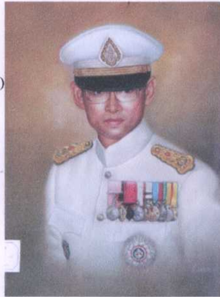
ลำดับ (ย. 2) 6 ศิลปิน โกเมศร์ (ไม่ทราบนามสกุล) ขนาด 43 X 59 ซม. ราคาประเมิน 10,000.- บาท