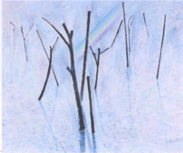
ลำดั่ง (ย.29) 14 (สนยามเช้า) ศิลปิน สวัสดิ์ ตันติสุข ขนาด 58 x 48 ซม. ราคาประเมิน 300,000.- บาท