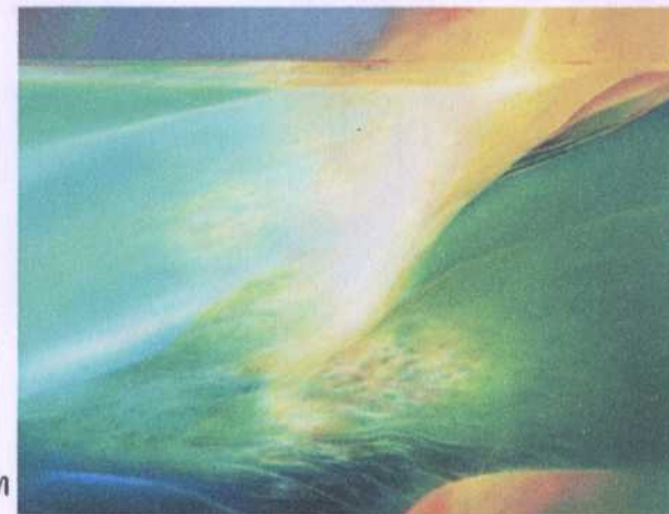
ลำดับ (ข.36) 13 ศิลปิน ประเทือง เอมเจริญ ขนาด 144 x 110 ซม. ราคาประเมิน 700,000.- บาท