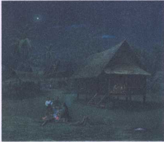
ลำดับ (ช. 26) 18 ศิลปิน จำรัส พรหมมินทร์ ขนาด 120 X 104 ซม. ราคาประเมิน 70,000.- บาท