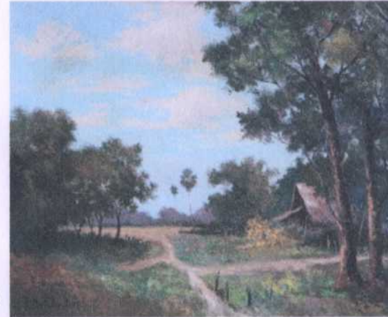
ลำดับ (ช. 32) 19 ศิลปิน มล.ป๋ม มาลากุล ขนาด 54 x 45 ซม. ราคาประเมิน 250,000.- บาท