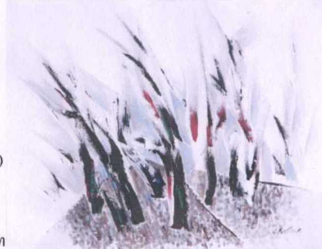
ลำดั่ง (ย.30) 15 (ลมหนาว) ศิลปิน สวัสดิ์ ตันติสุข ขนาด 88 x 68 ซม. ราคาประเมิน 300,000.- บาท