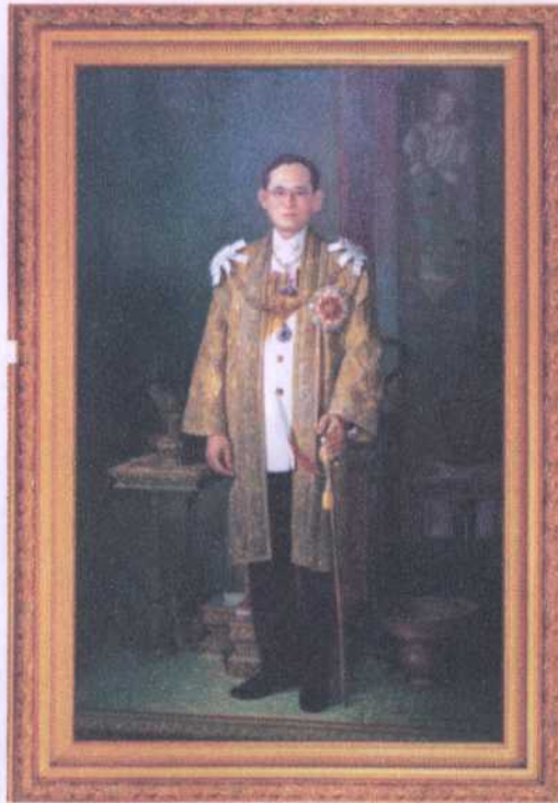
ลำดับ (ย.1) 1 ศิลปิน อุตสาหกรรม วิศวกรแสง ขนาด 120 x 190 ซม. ราคาประเมิน 300,000 บาท