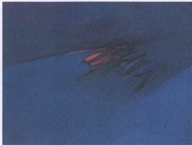
ลำดั่ง (ย.28) 16 ศิลปิน ประพันธ์ ศรีสุตา ขนาด 119 x 89 ซม. ราคาประเมิน 100,000.- บาท