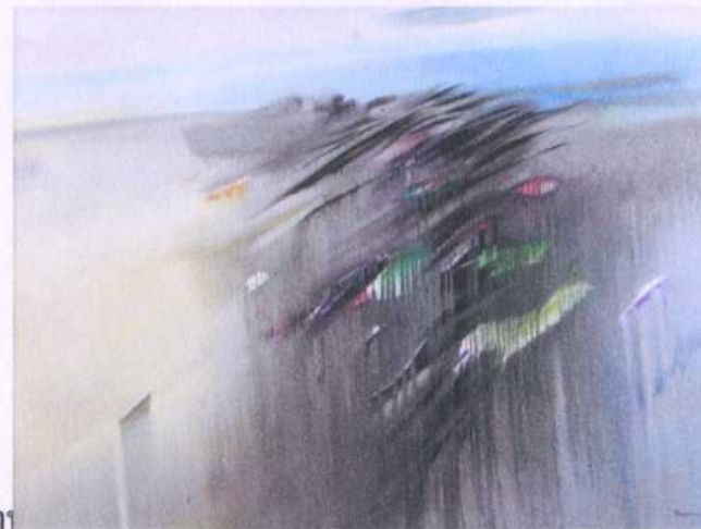
ลำดั่ง (ย. 37) 17 ศิลปิน ประพันธ์ ศรีสุตา ขนาด 159 x 118 ซม. ราคาประเมิน 120,000.- บาท