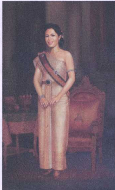
ลำดับ (ย.20) 2 ศิลปิน ไมตรี (ไม่ทราบนามสกุล) ขนาด 99 x 164 ซม. ราคาประเมิน 50,000.- บาท