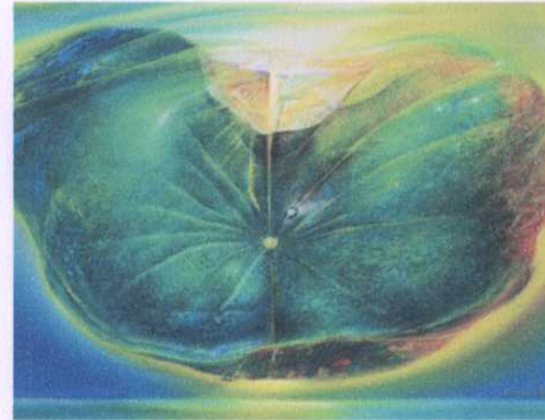
ลำดับ (ข.27) 11 ศิลปิน ประเทือง เอมเจริญ ขนาด 82 x 75 ซม. ราคาประเมิน 300,000.- บาท