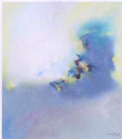
ลำดับ (ข.35) 12 ศิลปิน ประเทือง เอมเจริญ ขนาด 90 x 99 ซม. ราคาประเมิน 200,000.- บาท