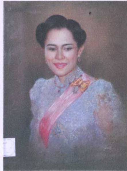
ลำดับ (ย.3) 7 ศิลปิน โกเมศร์ (ไม่ทราบนามสกุล) ขนาด 43 X 59 ซม. ราคาประเมิน 10,000.- บาท