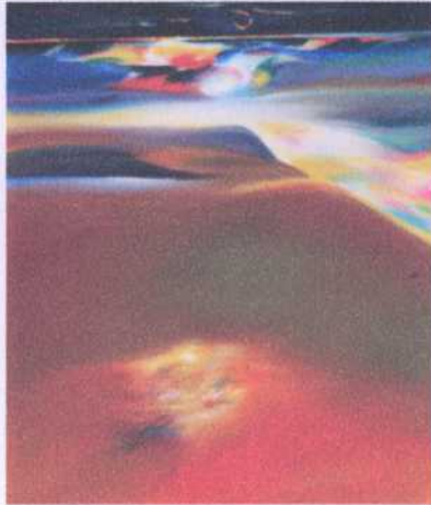
ลำดับ (ข.34) 10 ศิลปิน ประเทือง เอมเจริญ ขนาด 55 x 65 ซม. ราคาประเมิน 120,000.- บาท