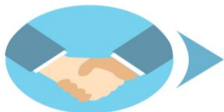
ผู้ทำสัญญา

การทำสัญญาป้องกันความเสี่ยงอัตราแลกเปลี่ยนการลงทุนในต่างประเทศ ต้องทำกับธนาคารพาณิชย์ไทย เท่านั้น