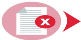
การยกเลิกสัญญา