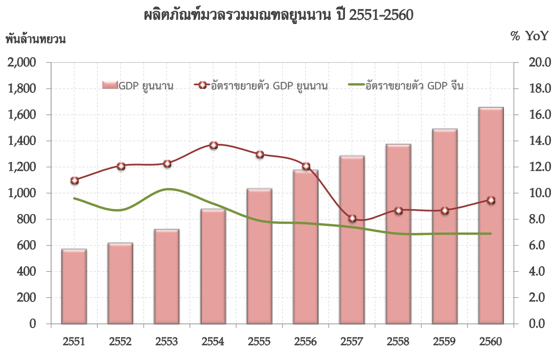
รูปที่ 1 ผลผลิตมวลรวมมณฑลยูนนาน ปี 2551 – 2560

ที่มา: CEIC Data, Yunnan Provincial Bureau of Statistics