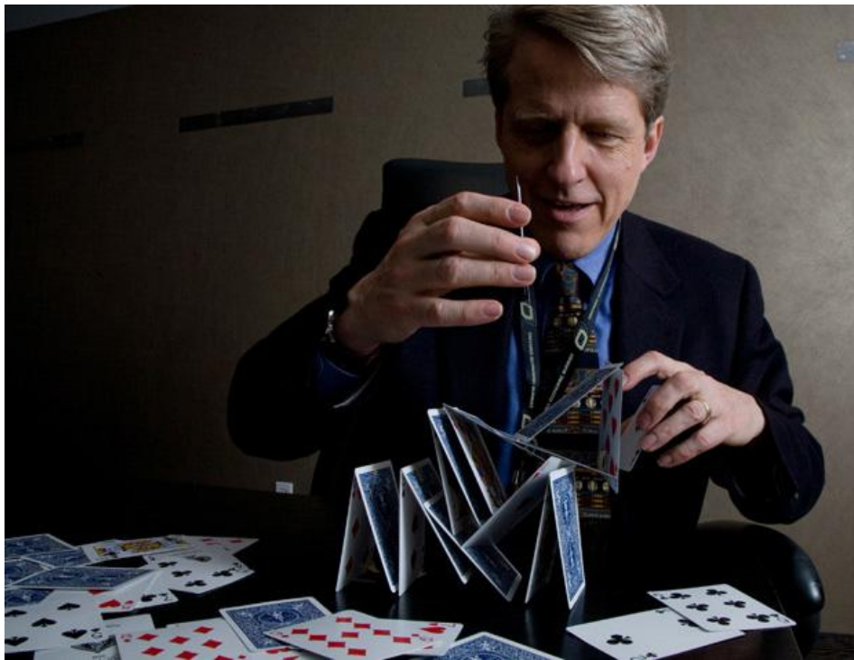
ศจ. โรเบิร์ต ซิลเลอร์ นักเศรษฐศาสตร์การเงิน มหาวิทยาลัยเยล

แปลและเรียบเรียงจาก "Ten Ways Finance Can be a Force for Good in Society" โดย ศาสตราจารย์ Robert Shiller, ตีพิมพ์ครั้งแรกใน Huffington Post