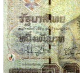
ตัวอย่าง ธนบัตรรัฐบาล