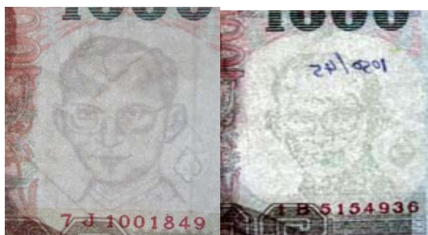
ตัวอย่าง ลายน้ำธนบัตรปลอม