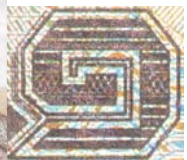
ตัวอย่าง ธนบัตรรัฐบาล