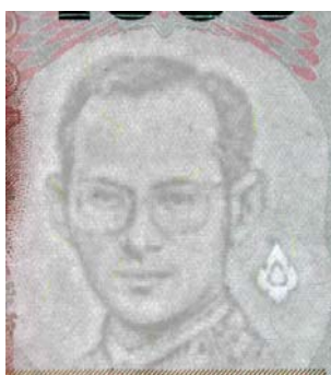
ตัวอย่าง ลายน้ำธนบัตรรัฐบาล