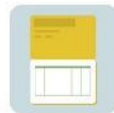
สมุดเงินฝากออมทรัพย์/ กระแสรายวัน