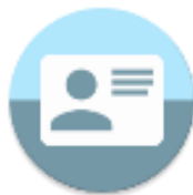
บัตรประชาชน