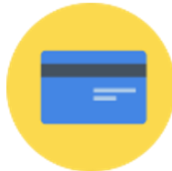
บัตรแบบแถบแม่เหล็กเดิม