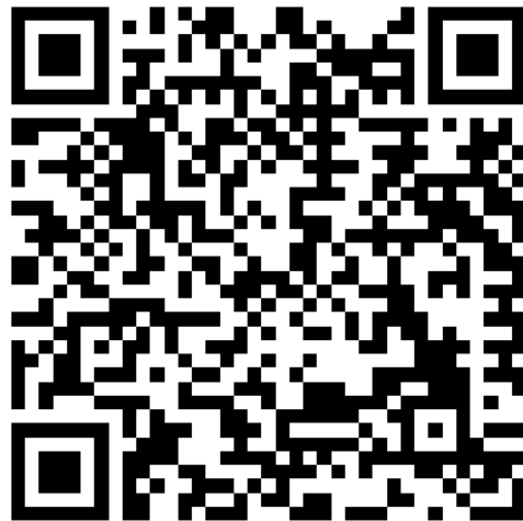
เอกสารฉบับเต็ม