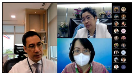
ประชุมหัวหน้าส่วนงาน (4 เม.ย.66)

นายเศรษฐพุฒิ สุทธิวาทนฤพุฒิ ผู้ว่าการ ธนาคารแห่งประเทศไทย ถ่ายทอดนโยบาย No Gift Policy ต่อที่ประชุมหัวหน้าส่วนงาน เพื่อเสริมสร้างวัฒนธรรมในการไม่รับของขวัญและของกำนัลทุกชนิดในการปฏิบัติหน้าที่