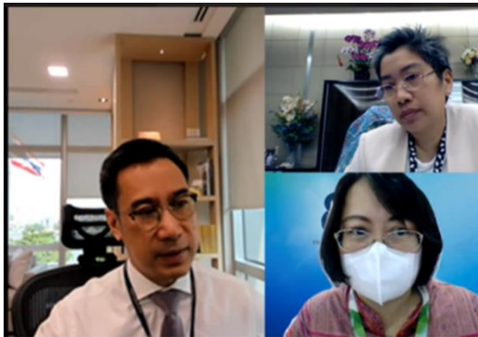
ประชุมหัวหน้าส่วนงาน (4 เม.ย.66)

นายเศรษฐพุฒิ สุทธิวาทนฤพุฒิ ผู้ว่าการ ธนาคารแห่งประเทศไทย ถ่ายทอดนโยบาย No Gift Policy ต่อที่ประชุมหัวหน้าส่วนงาน เพื่อเสริมสร้างวัฒนธรรมในการไม่รับของขวัญและของกำนัลทุกชนิดในการปฏิบัติหน้าที่