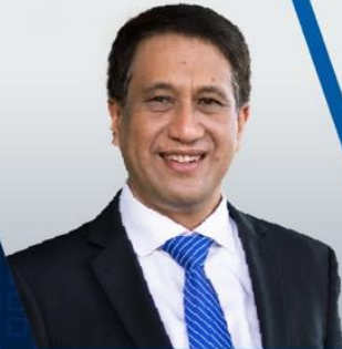
Mr. Ronadol Numnonda Deputy Governor Bank of Thailand