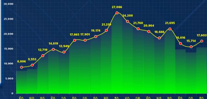
สถิติการรับแจ้งคดีออนไลน์