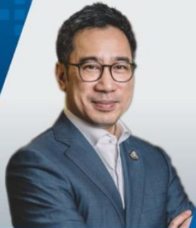
Dr. Sethaput Suthiwartnarueput Governor Bank of Thailand