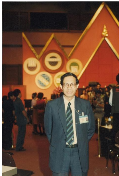
คุณวิจิตร สุพินิจ ดำรงตำแหน่ง ผู้ว่าการธนาคารแห่งประเทศไทยในขณะนั้น