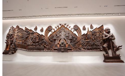
ภาพจำหลักไม้พระราชพิธีอินทราภิเษก ในปัจจุบัน

“จำหลักไม้พระราชพิธีอินทราภิเษก” (ไม้ประดู่แกะสลัก สีฝุ่น และสีน้ำมัน) โดย จรูญ มาถนอม