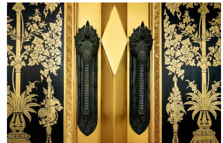
ภาพประตูกัลปพฤกษ์และมือจับพญานาค ในปัจจุบัน