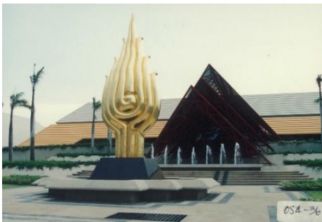
ภาพศูนย์การประชุมแห่งชาติสิริกิติ์ เมื่อปี 2534

การกลับมาครั้งนี้จึงเป็นมากกว่าการเป็นเจ้าภาพ แต่เป็นโอกาสที่ประเทศไทยจะได้บอกเล่าเรื่องราวการเจริญเติบโตตลอดกว่า 3 ทศวรรษที่ผ่านมา ย้อนกลับไปเมื่อปี 2534 การเปิดตัวของ “ศูนย์การประชุมแห่งชาติสิริกิติ์” นับเป็นหมุดหมายสำคัญในประวัติศาสตร์เศรษฐกิจไทย เพราะสถานที่แห่งนี้สร้างขึ้นเพื่อรองรับการประชุมประจำปีของกองทุนการเงินระหว่างประเทศ (IMF) และกลุ่มธนาคารโลก (World Bank Group) ครั้งที่ 46 โจทย์ใหญ่ของทีมออกแบบคือ การแสดงศักยภาพของประเทศไทยที่กำลังเติบโตทางเศรษฐกิจอย่างรวดเร็ว ผู้ออกแบบจึงเลือกใช้รูปทรงสถาปัตยกรรมไทยที่อ่อนช้อย ถ่อมตัว แต่สง่างามผสมผสานความทันสมัยผ่านวัสดุเหล็กและกระจกที่โปร่งตา เรียกว่าเป็นแลนด์มาร์คและสัญลักษณ์แห่งความสำเร็จของการประชุมครั้งนั้น ที่ไม่เพียงรองรับการหารือนโยบายเศรษฐกิจการเงินของโลก แต่ยังขับเคลื่อนเศรษฐกิจและสังคมไทยในฐานะเจ้าภาพอีกด้วย