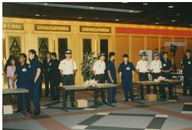
ภาพประตูกัลปพฤกษ์ และมือจับพญานาค เมื่อปี 2534

“ประตูกัลปพฤกษ์ และมือจับพญานาค” (แผ่นไม้สัก ลงรัก และปิดด้วยทองคำเปลว) โดย ไพเวช ว่างบอน