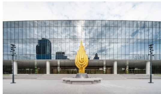
ภาพศูนย์การประชุมแห่งชาติสิริกิติ์ ณ ปัจจุบัน

“โลกุตระ” งานหล่อโลหะสำริด ทองคำเปลว โดย ชลุด นิมเมอ ได้รับแรงบันดาลใจมาจากเปลวรัศมีบนเศียรของพระพุทธรูป