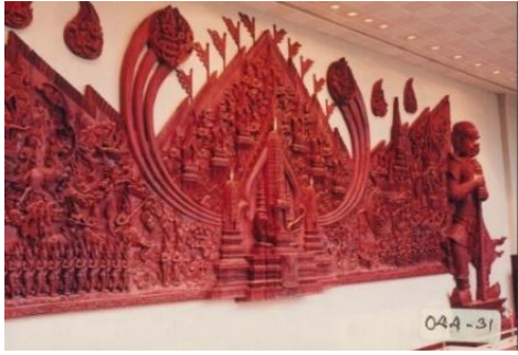
ภาพจำหลักไม้พระราชพิธีอินทราภิเษก เมื่อปี 2534