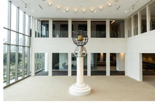
ภาพเสาซ่างลุกโลก เมื่อปี 2534