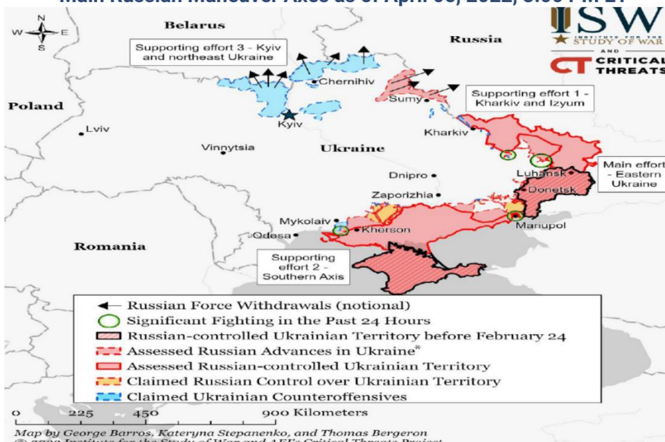
F1: Assessed Control of Terrain in Ukraine and Main Russian Maneuver Axes as of April 05, 2022, 3:00 PM ET