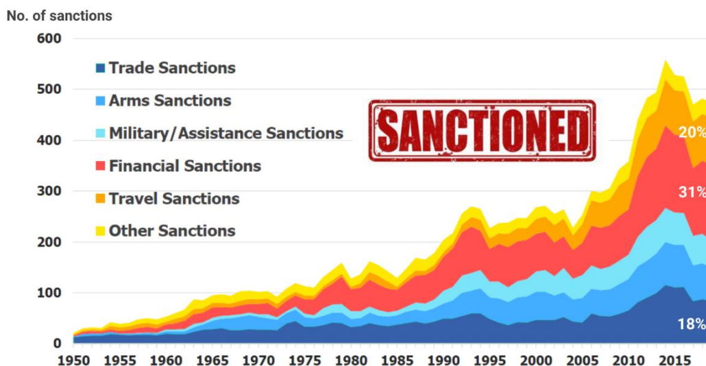
F2: Sanctions Implementations by Types, 1950-2019