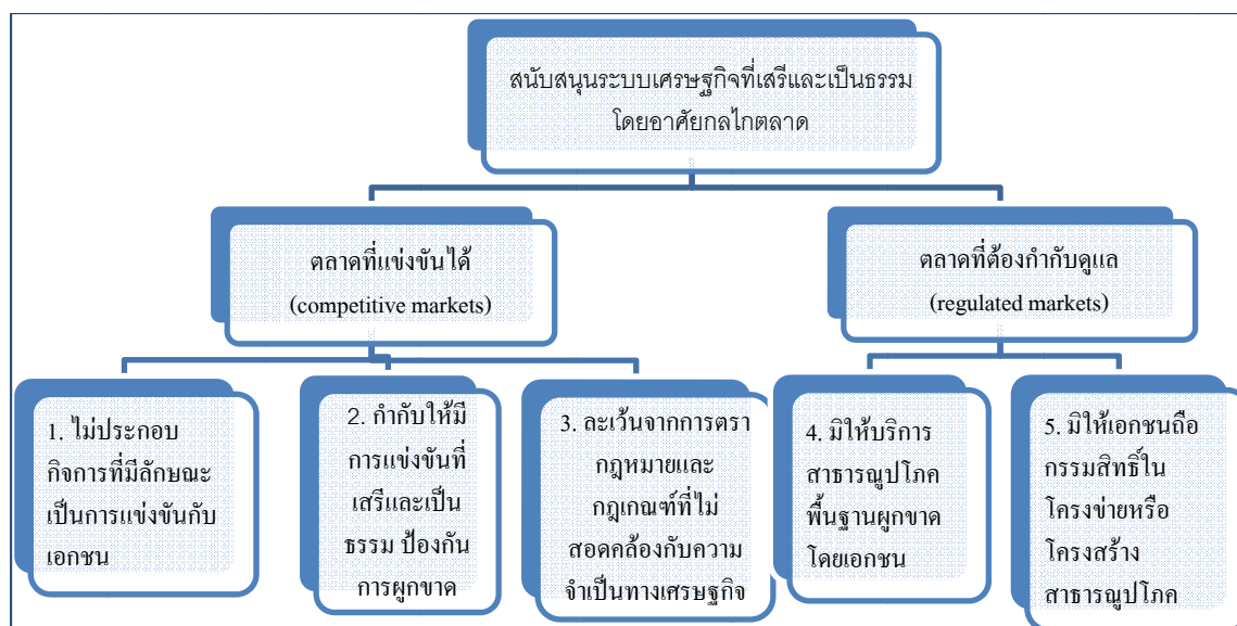
ภาพที่ 1 : บทบาทของภาครัฐในการส่งเสริมกลไกตลาดตามรัฐธรรมนูญฯ

งานวิจัยชิ้นนี้มีเป้าประสงค์ที่จะประเมินว่า ที่ผ่านมา รัฐบาลได้ปรับบทบาทของตนเองให้สอดคล้องกับพัฒนาการทางเศรษฐกิจของประเทศหรือไม่ โดยลดบทบาทในการเป็นผู้จัดหาบริการเองมาเป็นการส่งเสริมให้เอกชนเข้ามาเป็นผู้ให้บริการสาธารณูปโภค กำกับดูแลพฤติกรรมทางการค้าของบริษัทเอกชนมิให้ผูกขาด จำกัดหรือกีดกันการแข่งขัน หรือ เอาเปรียบผู้บริโภคหรือธุรกิจอื่นๆ ที่เกี่ยวข้อง โดยจะยึด