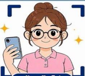
น้องกุกโก

เปลี่ยนหนี้เสีย ให้เป็นโอกาสเริ่มต้นใหม่