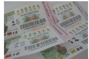
ลอตเตอรี่