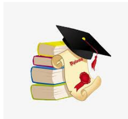
การศึกษา