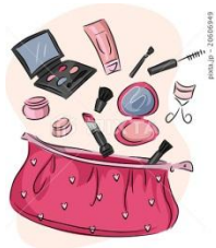
เครื่องสำอาง