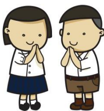
เสื้อผ้านักเรียน