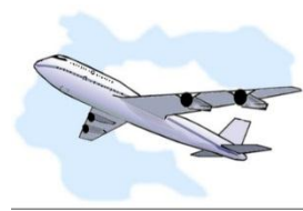
ท่องเที่ยว