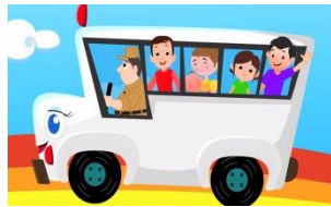
ค่าเดินทาง