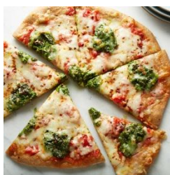
ค่าอาหารพิเศษ