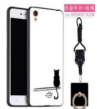
โทรศัพท์